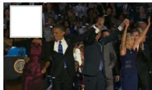
Bilder der Woche