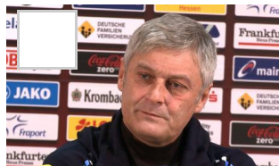
Veh: FCB nicht das Spiel des Jahres