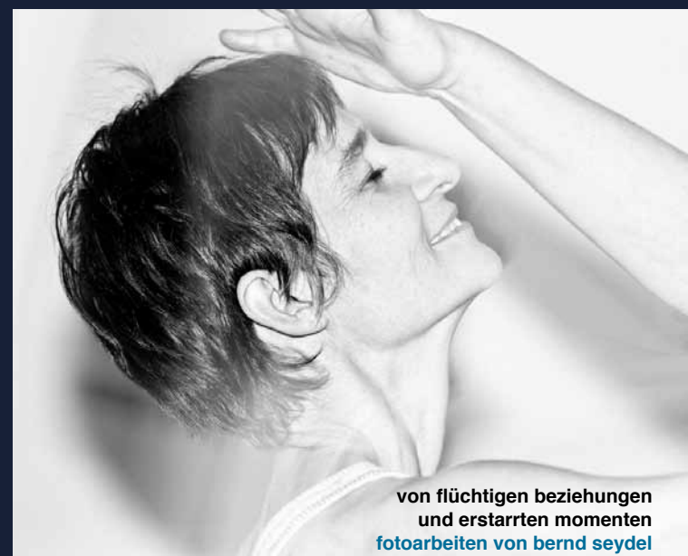
von flüchtigen beziehungen und erstarrten momenten fotoarbeiten von bernd seydel

WASSER SEIN 3. BIS 18. NOVEMBER 2012 FOTOARBEITEN BERND SEYDEL